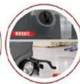
SISTEMA DE DOBLE SALIDA