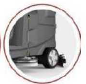
RUEDA ANTIDESLIZANTE DE GOMA